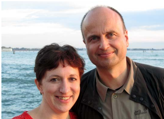
....unser aktuellstes Reisefoto 😊

Auch 4 Kinder gesellten sich als belebende Reisebegleiter hinzu - Beziehung: Eine lange Reise fürwahr, aber ein Weg, der sich lohnt!